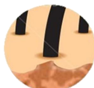
Выпадение волос с поверхности невуса