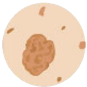
Появление «дочерних» родинок, или «сателлитов», возле основного образования