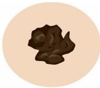
Неровность краев и уплотнение родинки