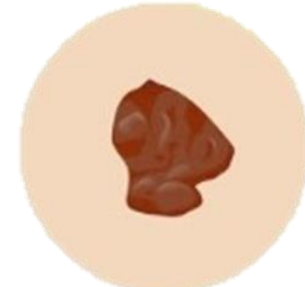
Увеличение в размерах