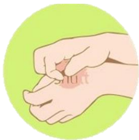
Зуд кожи, покалывание в области пигментного образования