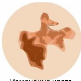
Изменение цвета, появление более светлых или темных участков на пигментном образовании