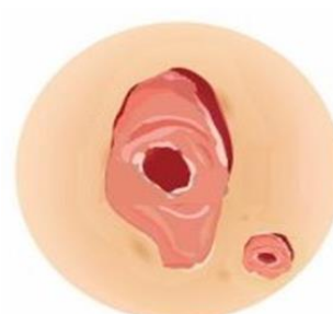
Появление язв и трещин, выделение крови или жидкости

Заболеваемость меланомой в Пермском крае: 5–7 человек на 100 тысяч населения